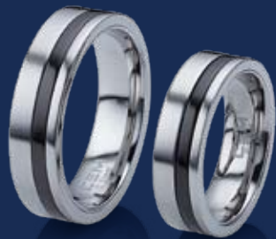
BFRE9047 21,00 Ringweiten 50-66 Ringbreite 6 mm