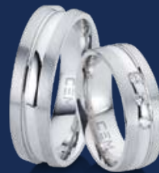
BFR99061 56,00 Zirkonia* Ringweiten 50-62 Ringbreite 6,5 mm