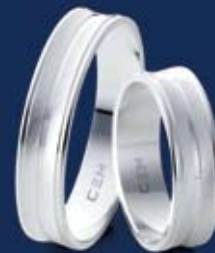
BFR99026 38,00 Ringweiten 50-70 Ringbreite 5 mm