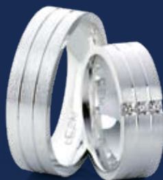
BFR99022 64,00 Zirkonia* Ringweiten 50-60 Ringbreite 6,5 mm