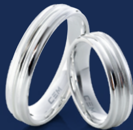
BFR99031 63,00 Ringweiten 50-70 Ringbreite 5 mm