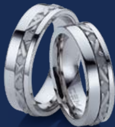
BFRE9048 21,00 Ringweiten 50-66 Ringbreite 6 mm