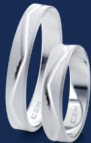
BFR99012 26,00 Ringweiten 50-70 Ringbreite 4 mm