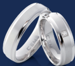
BFR99038 129,00 Brillant 0,03 ct wsi Ringweiten 50-60 Ringbreite 6 mm