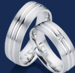
BFR99063 56,00 Zirkonia* Ringweiten 50-62 Ringbreite 6,5 mm