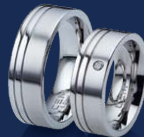
BFRE9054 21,00 Zirkonia* Ringweiten 50-62 Ringbreite 7 mm