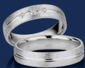
BFR99075 44,00 Zirkonia* Ringweiten 50-60 Ringbreite 5 mm

Das Edelmetall, von dem eine unvergleichliche Magie ausgeht, ist seit Jahrhunderten Sinnbild für eine hohe Beständigkeit. So trägt auch der Stern, unter dem die glücklichen Paare leben, zu Recht ein Kleid aus Silber.