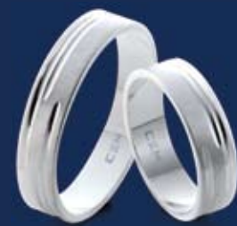
BFR99028 38,00 Ringweiten 50-70 Ringbreite 5 mm