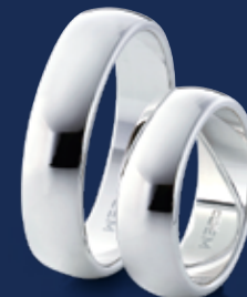
BFR99008 49,90 Ringweiten 50-70 Ringbreite 6 mm