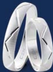
BFR99004 24,00 Ringweiten 50-70 Ringbreite 4 mm