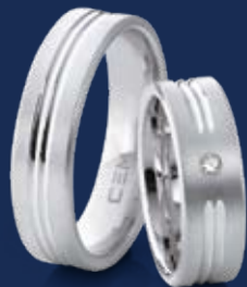
BFR99034 128,00 Brillant 0,03 ct wsi Ringweiten 50-60 Ringbreite 6 mm