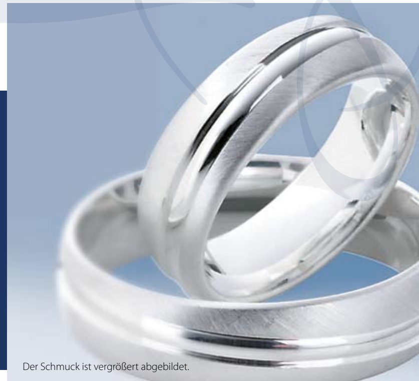
Der Schmuck ist vergrößert abgebildet.