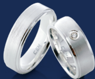
BFR99020 64,00 Zirkonia* Ringweiten 50-60 Ringbreite 6,5 mm