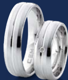
BFR99036 99,00 Brillant 0,02 ct wsi Ringweiten 50-60 Ringbreite 6 mm