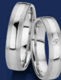
BFR99077 44,00 Zirkonia* Ringweiten 50-60 Ringbreite 5 mm