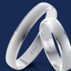
BFR99009 26,00 Ringweiten 50-70 Ringbreite 4 mm