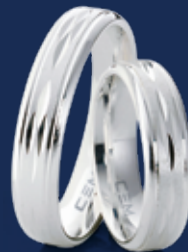
BFR99030 64,00 Ringweiten 50-70 Ringbreite 5 mm