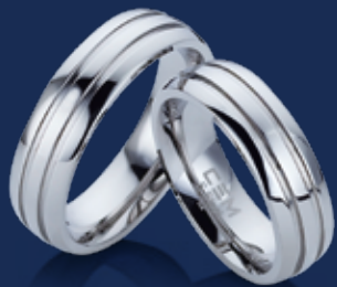
BFRE9046 15,00 Ringweiten 50-66 Ringbreite 6 mm