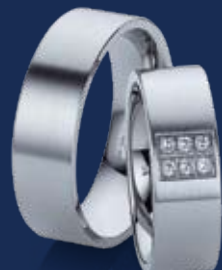
BFRE9052 24,00 Zirkonia* Ringweiten 50-62 Ringbreite 7 mm