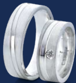
BFR99018 69,90 Zirkonia* Ringweiten 50-60 Ringbreite 6,5 mm