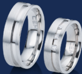
BFR99059 56,00 Zirkonia* Ringweiten 50-62 Ringbreite 6,5 mm