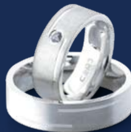
BFR99024 64,00 Zirkonia* Ringweiten 50-60 Ringbreite 6 mm