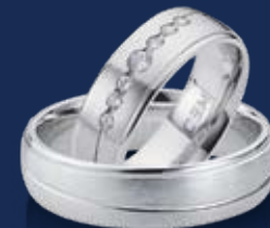
BFR99065 56,00 Zirkonia* Ringweiten 50-62 Ringbreite 6,5 mm