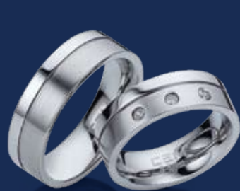
BFRE9050 24,00 Zirkonia* Ringweiten 50-62 Ringbreite 6 mm

Gradlinig, schnörkellos und in hohem Maße erotisch. Ringe aus diesem Material sind die kleinen, modernen Skulpturen der Kunst aus Freundschaft und Liebe.