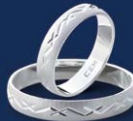
BFR99011 26,00 Ringweiten 50-70 Ringbreite 4 mm