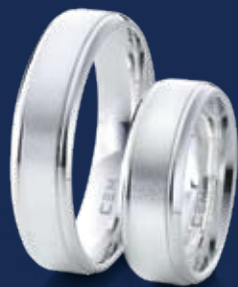
BFR99029 66,00 Ringweiten 50-70 Ringbreite 6 mm

Das weltweit beliebte, weißglänzende Edelmetall Silber präsentiert sich in der Friends-Collection auf eine wunderbare Weise neu. Material und Form in perfekter Harmonie. Zwei, die einfach zusammengehören.