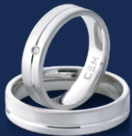
BFR99032 99,00 Brillant 0,02 ct wsi Ringweiten 50-60 Ringbreite 5 mm