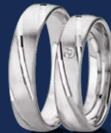
BFR99079 44,00 Zirkonia* Ringweiten 50-60 Ringbreite 5 mm