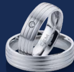
BFRE9056 21,00 Zirkonia* Ringweiten 50-62 Ringbreite 6 mm