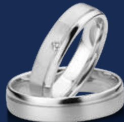
BFR99073 44,00 Zirkonia* Ringweiten 50-60 Ringbreite 5 mm