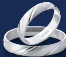
BFR99027 33,00 Ringweiten 50-70 Ringbreite 4 mm