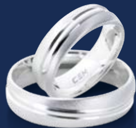
BFR99015 58,00 Ringweiten 50-70 Ringbreite 6 mm